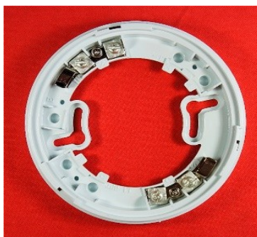
• Рисунок 1 - Базовое 4х – контактное основание SNR-302A

Ознакомиться с полным ассортиментом продукции можно по адресу : fires-expert.ru